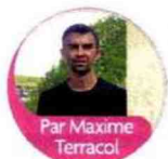
Par Maxime Terracol

Des exercices simples au fil de la journée